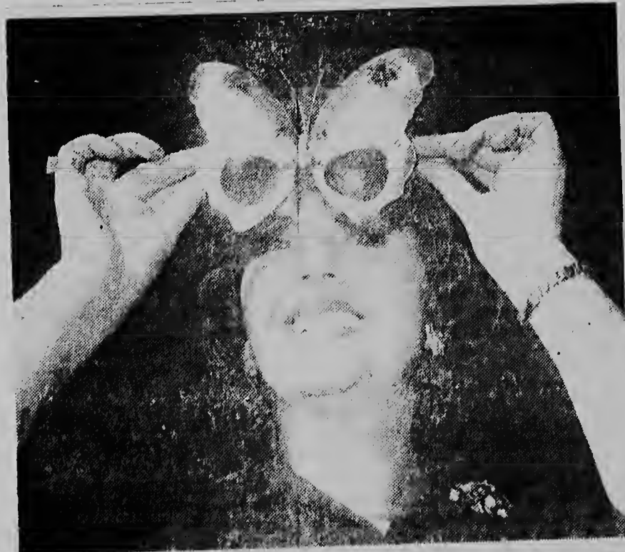
Na Blackpool (Inglaterra) a tene te dia 5 di februari e Beurs International pa regalo i galanterianan. Un dje articulonnan cu a yama atencion ta un bril di solo den forma di un barbuette grandi.